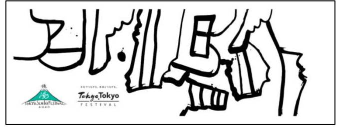
(アール・ブリュットオリジナルデザイン)

会期中に東京の約 500 ヶ所の銭湯を巡って、スタンプを規定数獲得した方には、「TOKYO SENTO Festival 2020 特製てぬぐい」を差し上げます。(在庫がなくなり次第終了)