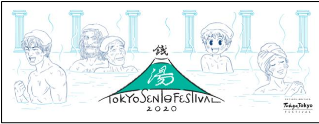
(ヤマザキマリオリジナルデザイン)