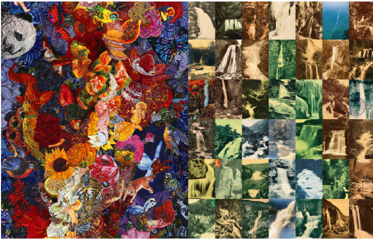
東京大壁画 (作品の一部)

このたび東京都と公益財団法人東京都歴史文化財団 アーツカウンシル東京は、主催する“Tokyo Tokyo FESTIVALスペシャル13”のひとつとして株式会社ドリルが企画するプログラム「東京大壁画」を発表します。本プログラムは、“Tokyo Tokyo FESTIVALスペシャル13”の最後に発表するこれまでシークレットとなっていた企画であり、オリンピック・パラリンピック期間の東京・丸の内において、アーティスト横尾忠則さん、横尾美美さんを起用した世界最大級の巨大壁画アート作品です。