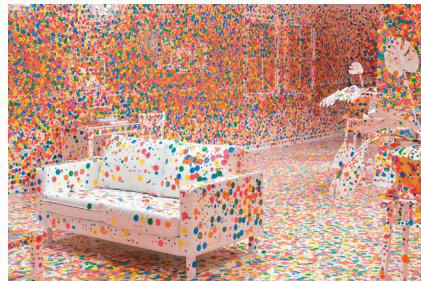
オブリタレーションルーム 作: 草間彌生(本プロジェクト案) © YAYOI KUSAMA Yayoi Kusama / The Obliteration room 2002-present Collaboration between Yayoi Kusama and Queensland Art Gallery, Commissioned Queensland Art Gallery. Gift of the artist through the Queensland Art Gallery Foundation 2012 Collection: Queensland Art Gallery, Australia 協力: オオクワフィンアート