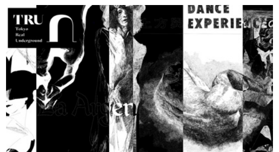
舞踏出来事ロジーイラスト: Yo Ishihara