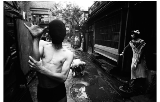
ウィリアム・クライン「Crab Dancer」©William Klein, Tokyo 1961

1961年に初来日した写真家ウィリアム・クラインは、約2ヶ月間東京の街を駆け回って撮影し、64年に写真集『東京』を発表しました。その中から銀座を写した10点をセレクトし、壁いっぱい引き伸ばして展示します。オリンピックを控えて混乱と熱気に包まれていた都市を、世界的写真家の眼はどう捉えたのか。日常の風景の中に、突如として60年前の景色が現れる、都市型の写真展です。