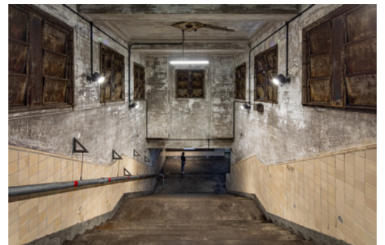
旧京成博物館動物園駅